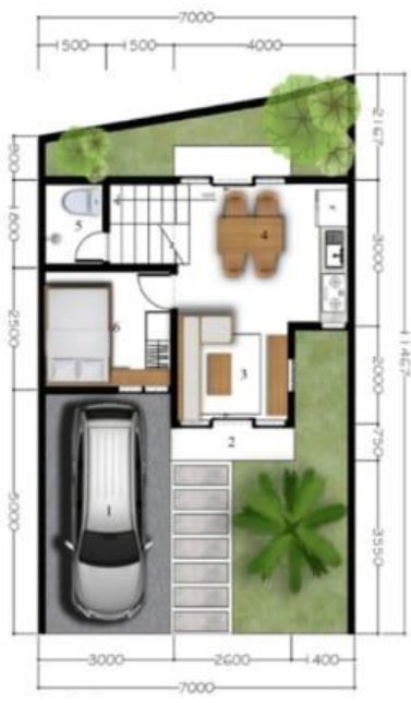
DENAH LT. 1