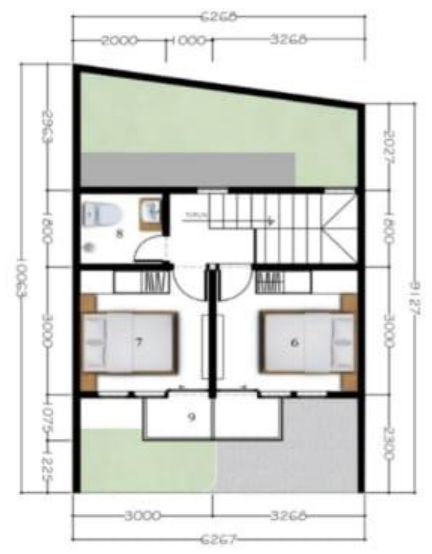
DENAH LT. 2