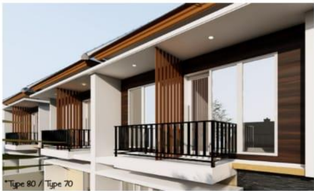
*Type 80 / Type 70