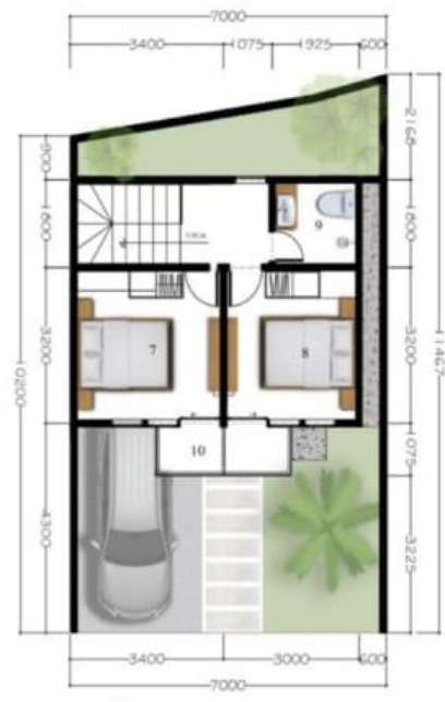
DENAH LT. 2