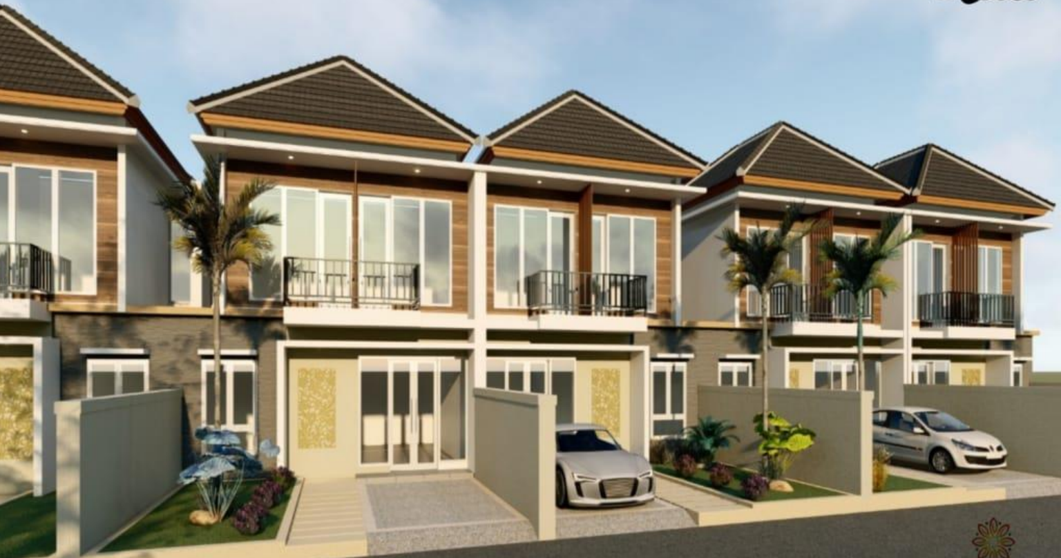
*Type 80 / Type 70