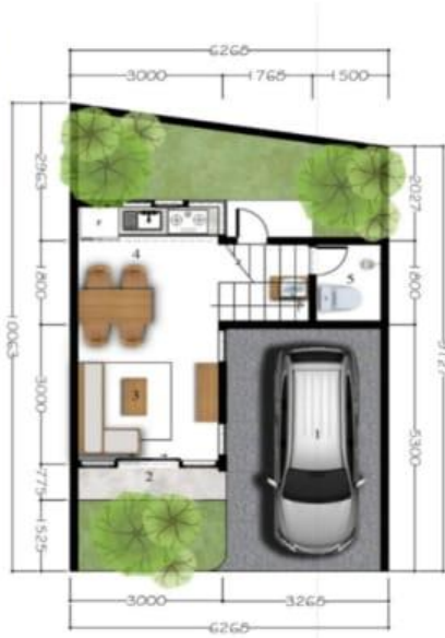
DENAH LT. 1